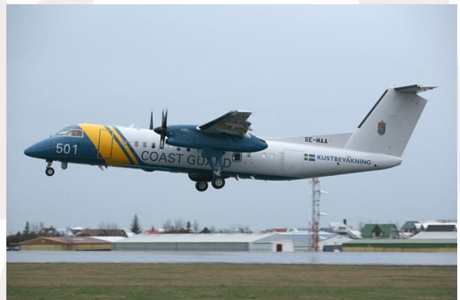
Samolot zwiadu morskiego szwedzkiej Straży Wybrzeża

Podczas następnych 4 miesięcy samolot DASH 8 będzie monitorował wody w rejonie Rogu Afryki w celu dostarczania informacji na temat ruchu statków.