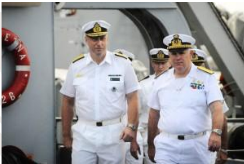
Nowy dowódca EU NAVFOR kontradmirał (LH) Jan Thörnqvist i odchodzący z funkcji kontradmirał (LH) Giovanni Gumiero wchodzą na uroczystość przekazania dowództwa na pokładzie ITS ETNA