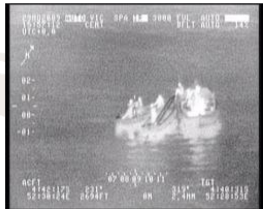
Statek matka i skiff widziane w podczerwieni

Ponad 930 marynarzy różnych narodowości eskortowano w tym czasie w tym 124 jednostki Indyjskie.