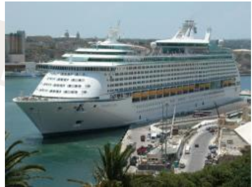
Seven Seas Voyager w Valletta