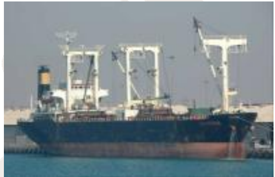
Drobnicowiec MV RAK AFRIKANA

Samolot zwiadu morskiego EU NAVFOR zauważył 8 osób na pokładzie jednostki z czego 3 to prawdopodobnie piraci. ITS SCIROCCO udaje się na miejsce porwania by zbadać sytuację. Po porwaniu jednostka zatrzymała się z powodu, prawdopodobnie, jakiejś awarii silników. Około