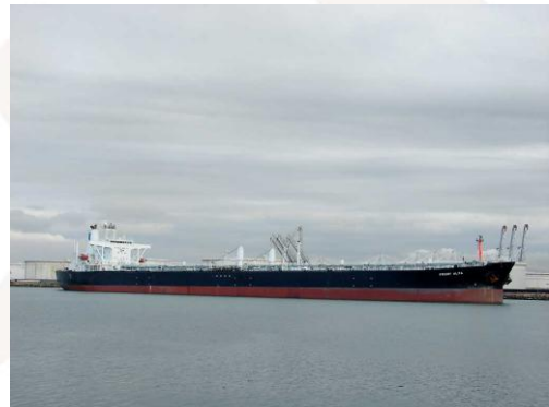
MV Front Alfa

Wieczorem 21.11.2010 MV FRONT ALFA raportował o ataku pirackim, którego stał się celem. Tankowiec przedsięwziął odpowiednie środki obrony przed piratami i ci zaniechali dalszych prób ataku.