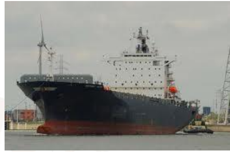
MV Northern Valour

zwiększeniu prędkości do 21 węzłów i zebraniu całej załogi zbędnej do kontrolowania statku, w bezpiecznym pomieszczeniu i zastosowaniu środków antypirackich. Oba skiffy nie mogąc dogonić jednostki, zrezygnowały z ataku.