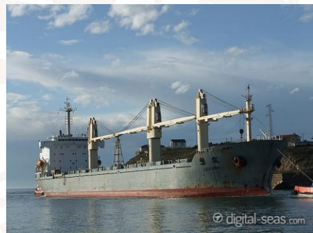
MV Le Cong

Kontenerowiec został ostrzelany przez piratów w dwóch skiffach. Nie zanotowano wejścia na pokład ani porwania.