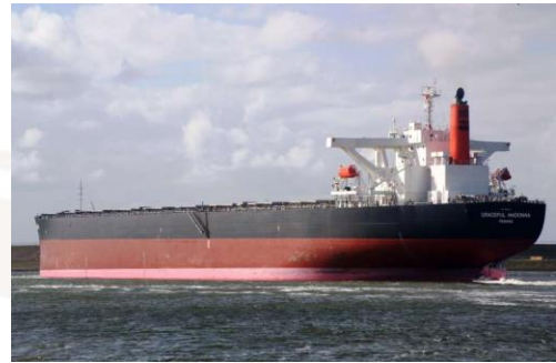
MV Graceful Madonna

Piraci uzbrojeni w broń palną i RPG za pomocą dwóch skiffów ścigali i ostrzelali masowiec. Statek zwiększył prędkość i przedsięwziął odpowiednie manewry anty-pirackie. Napastnicy próbowali kilka razy wdrzeć się na pokład, jednak dzięki agresywnym manewrom udało się uniknąć abordażu. Zanotowano uszkodzenia statku.