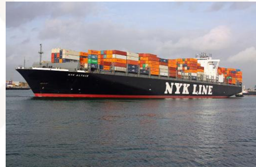
MV NYK Altair

W godzinach porannych kapitan MV NYK ALTAIR raportował o ataku pirackim, w którym brały udział 2 skiffy i użyte zostały RPG. Załoga kontenerowca przeprowadziła manewry wymijające i dzięki temu udało się uniknąć abordażu.