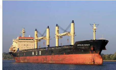
MV African Eagle

Sześciu piratów w maskach i uzbrojonych w broń palną oraz RPG w skiffie ostrzelało dryfujący masowiec z zamiarem porwania. Statek zwiększył prędkość i zastosował odpowiednie manewry w celu uniknięcia abordażu. Piraci zrezygnowali ze względu na drut kolczasty i specjalne ogrodzenie pod napięciem wokół statku. Nie zanotowano rannych.