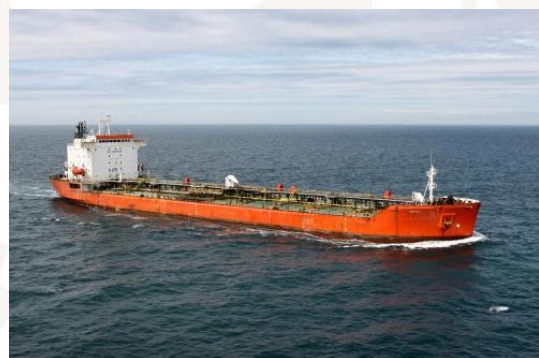
MV Norna N

Sześciu piratów uzbrojonych w broń automatyczną i RPG w skiffie ścigało i ostrzelało tankowiec. Dzięki zastosowaniu manewrów wymijających oraz takich środków obrony jak węże przeciwpożarowe i druty pod napięciem rozpięte na burtach, udało się uniknąć abordażu. Statek i załoga wyszły bez szwanku.