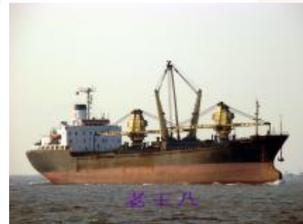
MV Yuan Xiang

Uzbrojeni piraci wtargnęli na pokład kontenerowca pod panamską banderą i wzięli 29-osobową załogę jako zakładników.